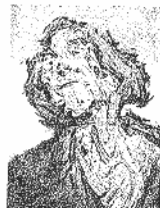
'New dawn fades', de Glenn Brown.

La artista portuguesa Joana Pimentel (Oporto, 1971) ha saltado a la fotografía desde la escultura figurativa. La imposibilidad de desarrollar en este soporte un trabajo que le permitiera expresar la adecuada dimensión realista de las cosas, le ha llevado al trabajo fotográfico al que carga de enorme dimensión literaria. Torsos de mujeres frente al mar, cuyos cuerpos sirven de papel en blanco, expresan un trabajo que quiere conjuntar clasicismo y modernidad, y pensamiento y estética. Esta primera exposición en España muestra piezas pertenecientes a la serie Obras abiertas inspiradas en el libro de Umberto Eco Obra abierta , que defiende el carácter inconcluso que tiene toda creación. En Obras escritas confiere, debido a que las palabras son escritas encima de la fotografía, el carácter de obra única. JAUME VIDAL