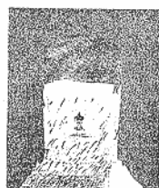
'Cartes', de Antoni Tàpies.