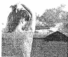
'Obra escrita I' (2003).

Esta antológica de Antonio Saura (Huesca, 1930-Cuenca, 1998), que con 113 obras es la mayor de cuantas se han realizado de este gran precursor del informalismo y fundador del grupo El Paso, tiene además el atractivo añadido de que la mitad de las piezas se muestran por primera vez al público. La exposición incluye 54 obras del legado de la familia Saura. Se trata de óleos y técnicas mixtas de las series Mujeres-sillón y de los collages de Superposiciones , obras sobre superficies impresas realizadas entre 1974 y 1977. La antológica trata los temas que obsesionaron al artista durante toda su carrera desde que, a finales de los años sesenta, abandonó el surrealismo y se zambulló de lleno en el informalismo por el que es conocido internacionalmente. MARGOT MOLINA