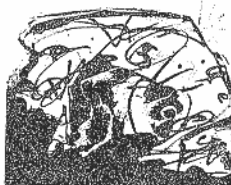
'El perro de Goya', de A. Saura.

Por otra parte, en esta obra el artista ha sustituido las imágenes fijas en papel fotográfico, que provocaban en el espectador un dinamismo de la mirada, inducido por el sentido del recorrido, por las imágenes de un inevitable vídeo que, dada su focalidad, exige, por el contrario, un estatismo pasivo del espectador, lo que entra en contradicción con los presupuestos de la obra enunciados en una cartela desde la que se invita a los visitantes a penetrar y recorrer el conjunto.