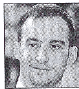
Alejandro Amenábar (33)