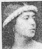
Catalina Bonnin "Aurora Bertrana. L'aventura d'una vida"