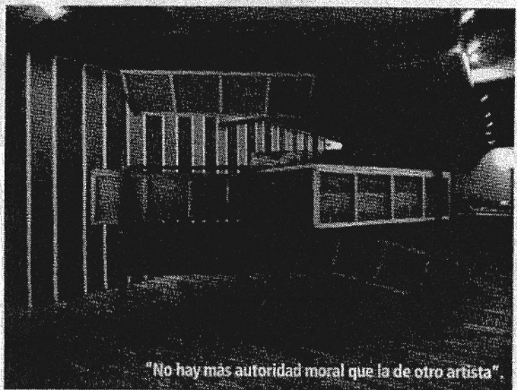
"No hay más autoridad moral que la de otro artista".

Allí se internó en nuevos campos creativos. Formado en la escultura, sus trabajos han ido explorando distintos soportes y formatos: sus instalaciones beben de la arquitectura, la fotografía o el cine y se plasman en grandes montajes de madera con combinaciones de cajones, falsas ventanas y muebles de utilidad imposible. En las esculturas es frecuente la estruc-