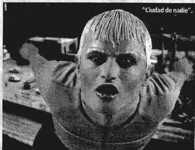
"Ciudad de nadie".