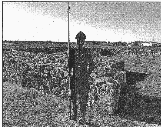
Algunos de los cimientos de piedra excavados de la aldea medieval.

Durante la hora y media que dura la visita aproximadamente,