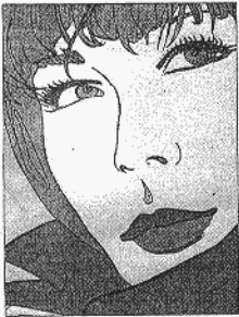
Una de las obras.

Último día para visitar la muestra '10 profesores de dibujo' en el Teatro Calderón