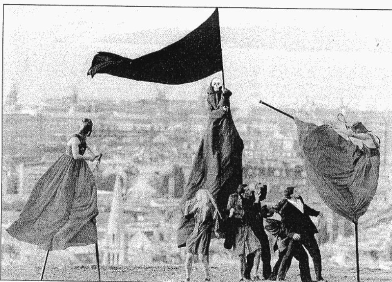
Los polacos de Biuro Podrozy Teatre combinan en 'Carmen Fúnebre' zancos, fuego, música y sorprendentes efectos especiales.