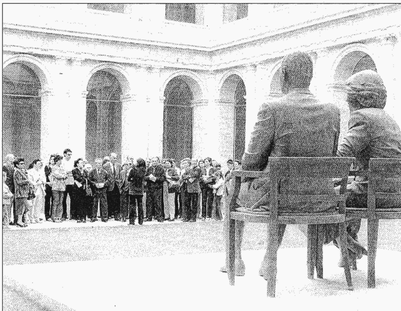
Un grupo asiste a la visita guiada del Patio Herreriano en el Día Internacional de los Museos de 2002.