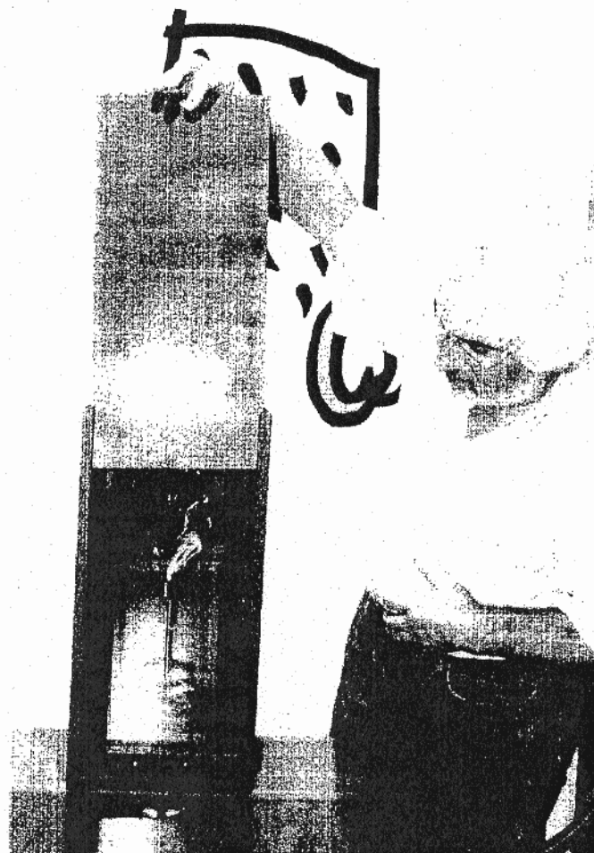
El artista explicó a ABC el proceso de creación del premio