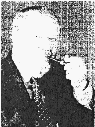
José Luis Balbín