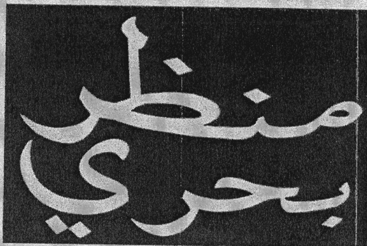
"Mantar Bahari (Marina)".