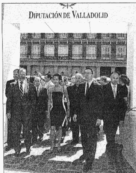
León de la Riva, Cantalapiedra, Recio, Gallardón y Ruiz Medrano.