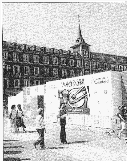
Imagen del nuevo 'traje' que viste la Plaza Mayor de Madrid.