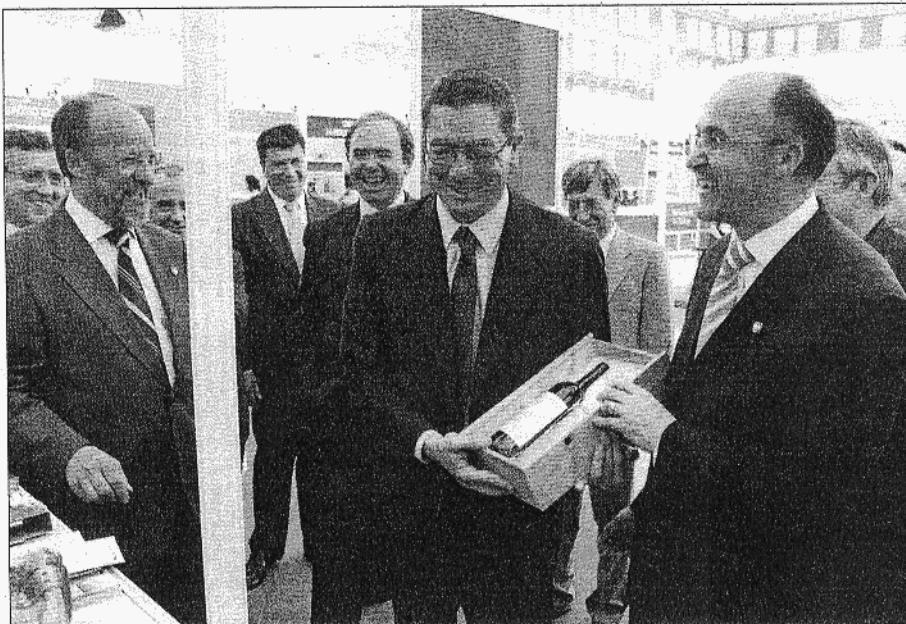
Ruiz Gallardón recibe una botella de vino de manos del presidente de la Diputación (dcha.) y el alcalde de Valladolid.

Por otra parte, los habitantes de la capital pudieron probar los mejores pinchos, algunos de los que hace unos días se hicieron con el galardón de oro en el concurso vallisoletano como el 'Bombón de Seri' (calabacín relleno de verduras en salsa española con alberchigos y melocotones y un crujiente de torreznillo), o 'Capricho' (carpacho de fresas sobre pan de pasas y nueces con queso de Pollos, reducción de Módena y langostino en aceite de avellana».