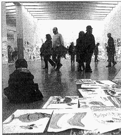
Los visitantes recorren el museo en una imagen de archivo.

renacentista en Valladolid. El Domus Artium 2002 en Salamanca tiene el marco más moderno: una reformada prisión. El Centro de Arte Caja de Burgos combina una colección permanente de 300 piezas con exhibiciones especiales».