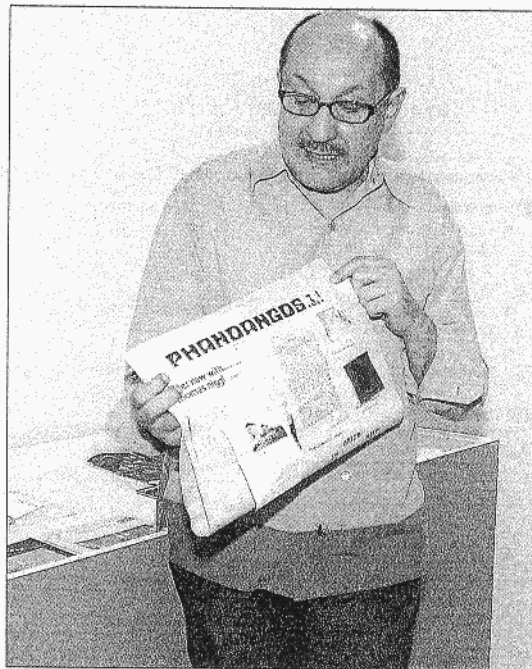
El comisario comenta un ejemplar de la revista 'Phandangos'.