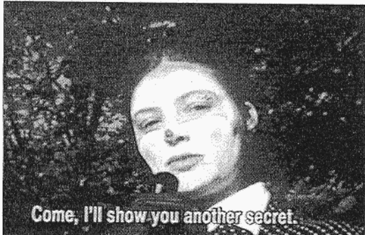
Fotograma de la pieza de Sandra Sterle incluida en la exposición.