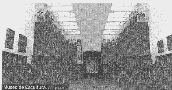
Museo de Escultura. / EL NORTE

Museo de San Joaquín y Santa Ana. Pza. Santa Ana, 4. ☎983 357 672. Lunes a viernes, 10 a 13.30 y 17 a 20. Sábados y festivos 10 a 14.30. Museo Oriental. Paseo Filippinos, 7. ☎983 306 800 y ☎983 306 900. De lunes a sábado, 16 a 19. Dom. y festivos 10 a 14. MUVA (Museo de la Universidad). Palacio de Santa Cruz, Sala de San Ambrosio. Plaza Santa Cruz, 8. ☎983 423 240. Se puede visitar de lunes a sábado, de 12.00 a 14.00 y de 18.00 a 21.00 horas. Visitas guiadas, a las 13.00 y 19.00 horas. Museo Fundación Cristóbal Gabarrón. Calle Rastrojo, cv/Barbecho. ☎983 362 490. De martes a viernes, de 10 a 14 y de 17 a 21 h. Sábados y domingos, de 11 a 14 horas. Casa-Museo de Cervantes. Rastro, s/n. ☎983 308 810. De martes a sábado, 9.30 a 15.00. Domingo, 10 a 15. Lunes, cerrado. Museo Academia de Bellas Artes. (Casa Museo Cervantes). Plaza España, 7. ☎983 211 609. Grupos, cita concertada: martes a viernes, de 9 a 13. Visitas sin cita concertada: martes a viernes, de 11 a 13. Museo Diocesano y Catedralicio. Arribas, 1. ☎983 304 362.