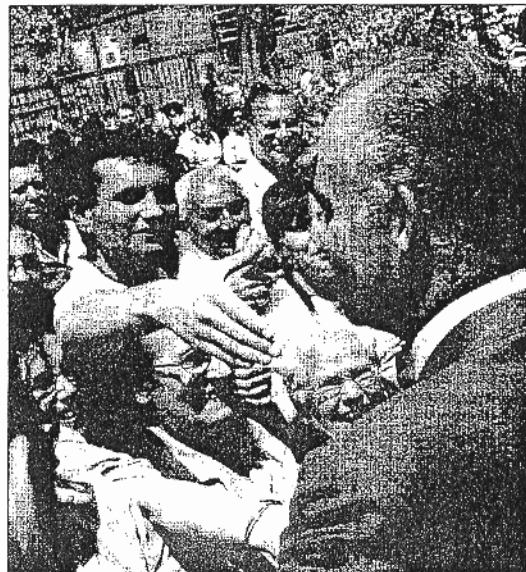
El Rey saludó a los ciudadanos que esperaban en la calle

Las obras se dividen en cuatro ciclos: desde el inicio de las vanguardias y su desarrollo hasta la Guerra Civil (1918-1940); los autores de posguerra (1940-1957); el auge del arte contemporáneo en España (1957-1970), y su consolidación (1970-2002).