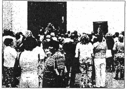
Un grupo de asistentes ante Las Meninas , de Velázquez.