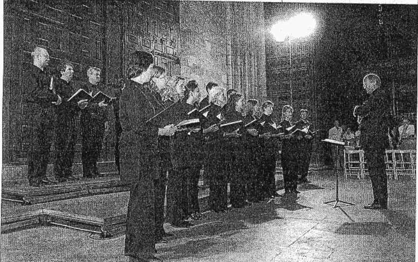
Imagen de uno de los espectáculos incluidos en ediciones anteriores es este ciclo musical.