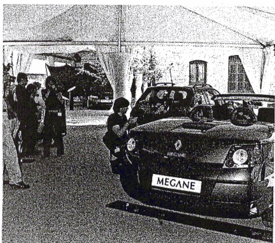
La exposición de Valladolid se organizó bajo el título "Paisaje Mégane".