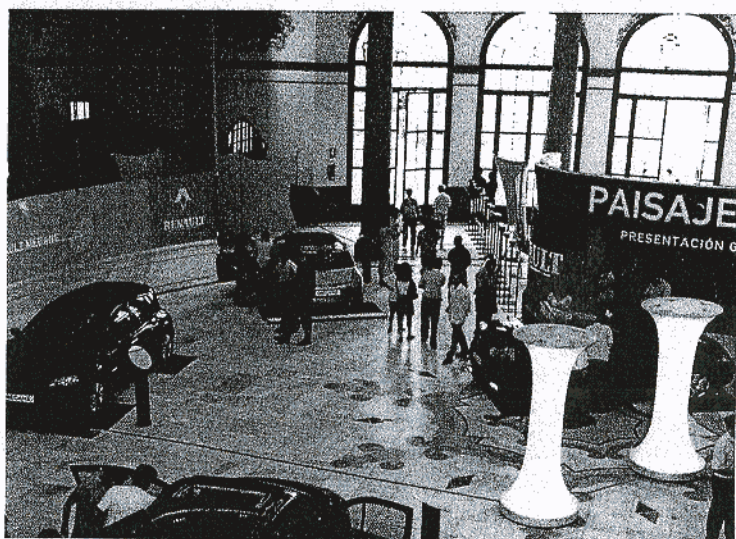
En Sevilla, el lugar elegido para la muestra fue el Casino de la Exposición.

La quinta zona de la exposición mostró las seis versiones de la gama Mégane para que los visitantes pudieran ver y tocar los automóviles, apreciando personalmente sus cualidades y equipamientos. Esta zona se tituló "Un coche para cada cliente", e incluyó una detallada descripción de las características técnicas de los vehículos. ■ O.G.