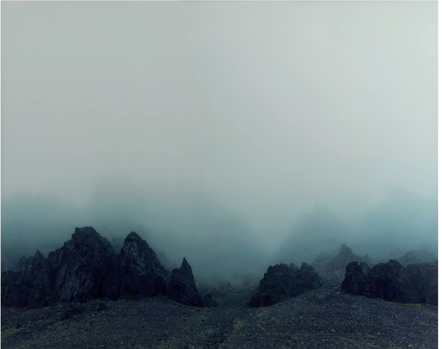
© Axel Hütte. Island Fog [Niebla isleña] , 2002