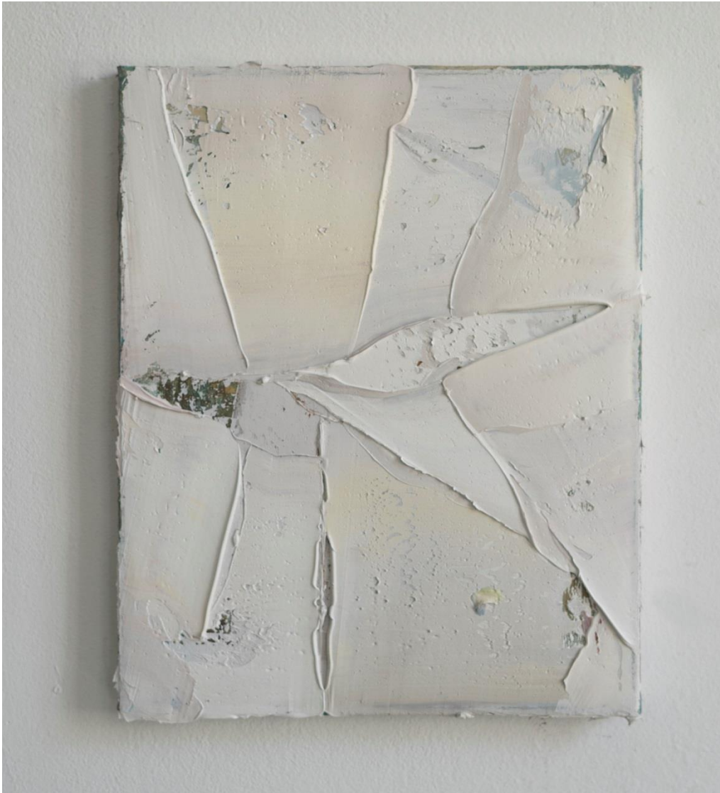
Mercedes Mangrané, Blanco roto . 2019