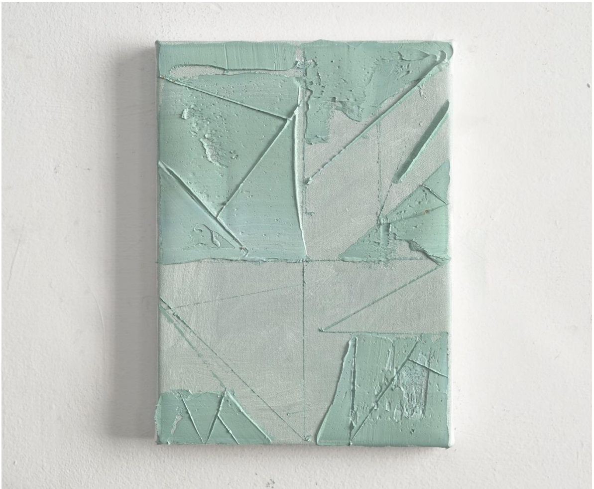
Mercedes Mangrané, Ventana rota . 2019