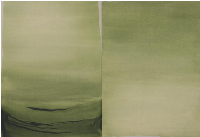
Nico Munuera. Viridis Ripa duo II , 2018. Cortesía del artista