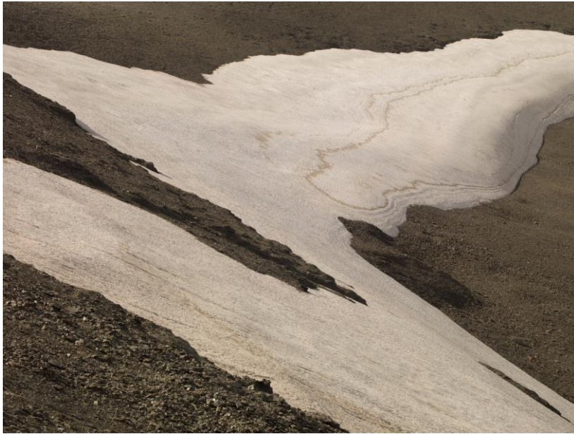
José Guerrero. Sierra Nevada #11 , 2015. Cortesía del artista