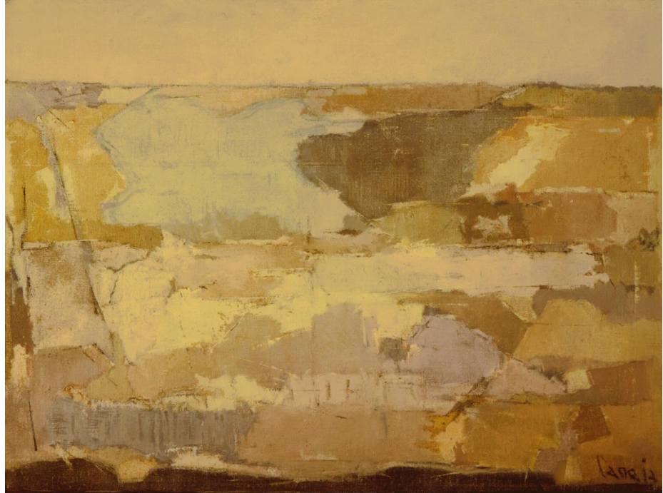
Juan Manuel Díaz Caneja. Paisaje, 1980. Asociación Colección Arte Contemporáneo