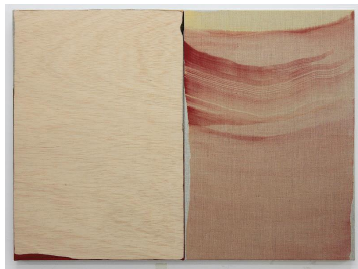
Nico Munuera. Margo Terminus II , 2017. Cortesía del artista