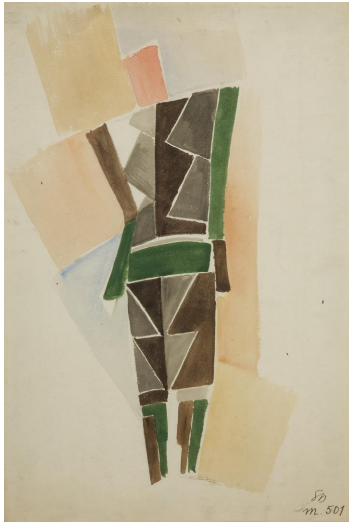
Sonia Delaunay. Costume de sport , 1925. Acuarela sobre papel. 43x29 cm. Asociación Colección Arte Contemporáneo

De 1925 es este “costume de sport” que realizó para Adam, la revue de l’homme . Toda su vida se caracteriza por la búsqueda de un arte total, hace pintura, collages, ilustración de libros, encuadernaciones, moda, tejidos, decoración... para ella todo tiene la misma importancia. “Para mí no hay diferencia (brecha) entre mi pintura y lo que llaman mi trabajo “decorativo”” y con ello pretende además que el simultaneísmo llegue a la cultura popular, que alcance todos los ámbitos de la vida.