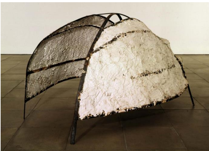
Susana Solano. Serie la lluna n°4 , 1985 Hierro y escayola Asociación Colección Arte Contemporáneo