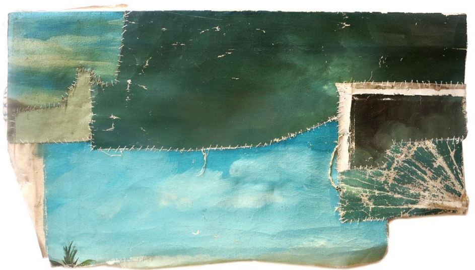
JULIO FALAGAN Datos artísticos