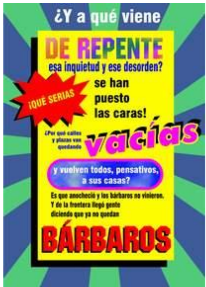
Rogelio López Cuenca. Madera y pasta policromadas, 2003. Impresión digital sobre papel fotográfico