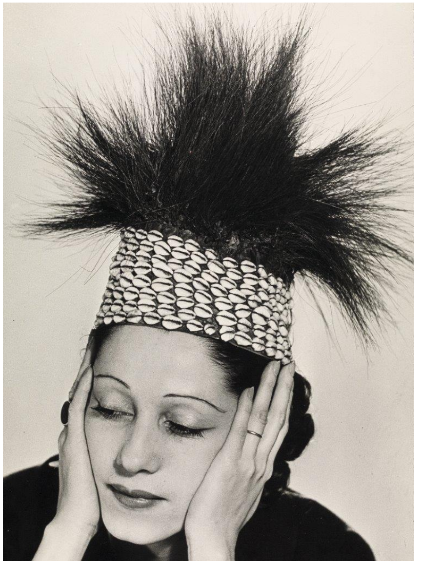
EFIMERA. MAN RAY. La mode au Congo.1937.