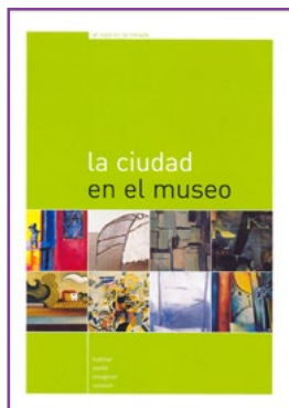
LIBRO del PROFESOR