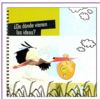
MATERIAL del ALUMNO

Cuaderno espiral tapa dura 12 páginas con imágenes a color, 12 en blanco / 23 x 23 cm ISBN: 978-84-96286-14-6 / Edición castellano