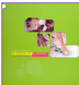
MATERIAL del ALUMNO