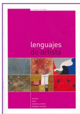
LIBRO del PROFESOR

Textos: Beatriz Pastrana, Teresa Saravia 16 páginas con imágenes a color y desplegables / 23 x 23 cm ISBN: 84-96286-00-2 / Edición castellano