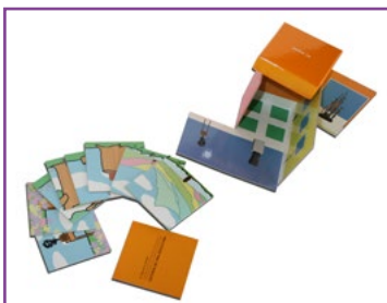
MATERIAL del ALUMNO