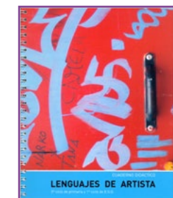
MATERIAL del ALUMNO