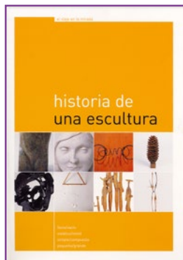
LIBRO del PROFESOR